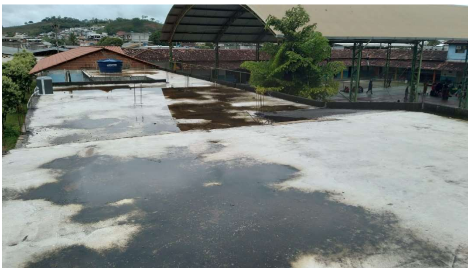
FOTO TIRADA SOBRE A LAJE A SER IMPERMEABILIZADA, EM DIAS DE CHUVAS. VERIFICA-SE ACÚMULO DE ÁGUA QUE INFILTRA NA LAJE.