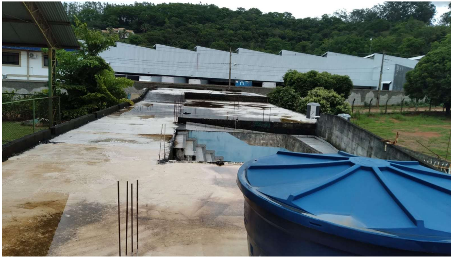
FOTO TIRADA SOBRE A LAJE A SER IMPERMEABILIZADA, EM DIAS DE CHUVAS. VERIFICA-SE ACÚMULO DE ÁGUA QUE INFILTRA NA LAJE.

TEL: (32) 3574-1319 – e-mail: licitacao@tocantins.mg.gov.br AVENIDA PADRE MACÁRIO, 129 - CENTRO CEP: 36.512-000 – TOCANTINS/MG